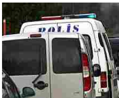
"Voleva fare come nei porno tedeschi": donna turca taglia la testa al