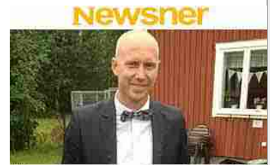
His message to parents spoiling their kids is killing the internet And you'll understand why...