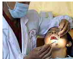
Un ragazzo di 17 anni e 18 mesi di dolore in bocca, poi la scoperta: rimossi