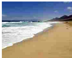
Sesso in spiaggia da record, 23enne campano ha rischiato amputazione