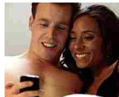
Sesso, al Congo il record per le 'dimensioni'. Ma gli italiani sono ben