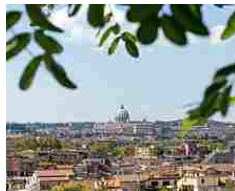
Allarme del Papa: Is può arrivare fino a Roma