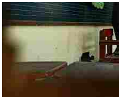
Sesso a scuola tra il preside e la Prof: alunna li scopre e fa un filmino